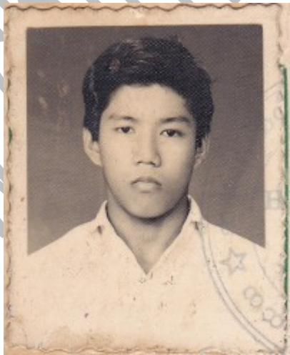
(နဝမတန်းကျောင်းသားဘဝ က ဆလောင်းတင်မောင်ဦး)